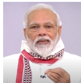
Премьер-министр г-н Нарендра Моди

“ Это видение Индии - превращение кризиса в возможность - окажется столь же эффективным в нашем стремлении к самодостаточной Индии. ”