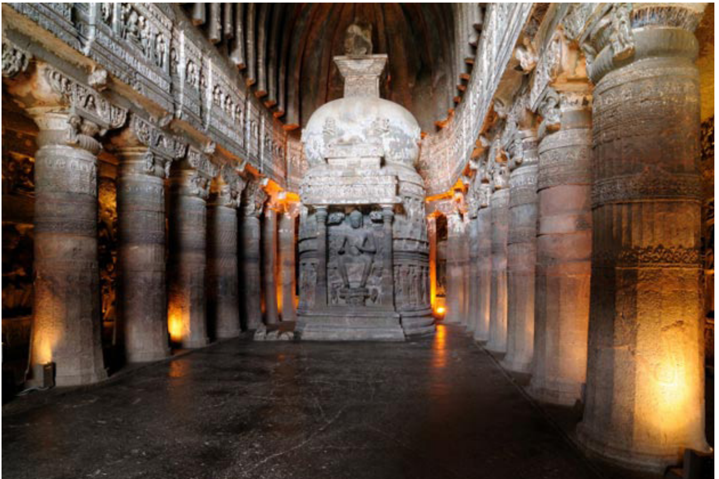
Пещеры Аджанга, Махараштра

ного планирования, основываясь не на том, что было добавлено, а то, что было удалено.