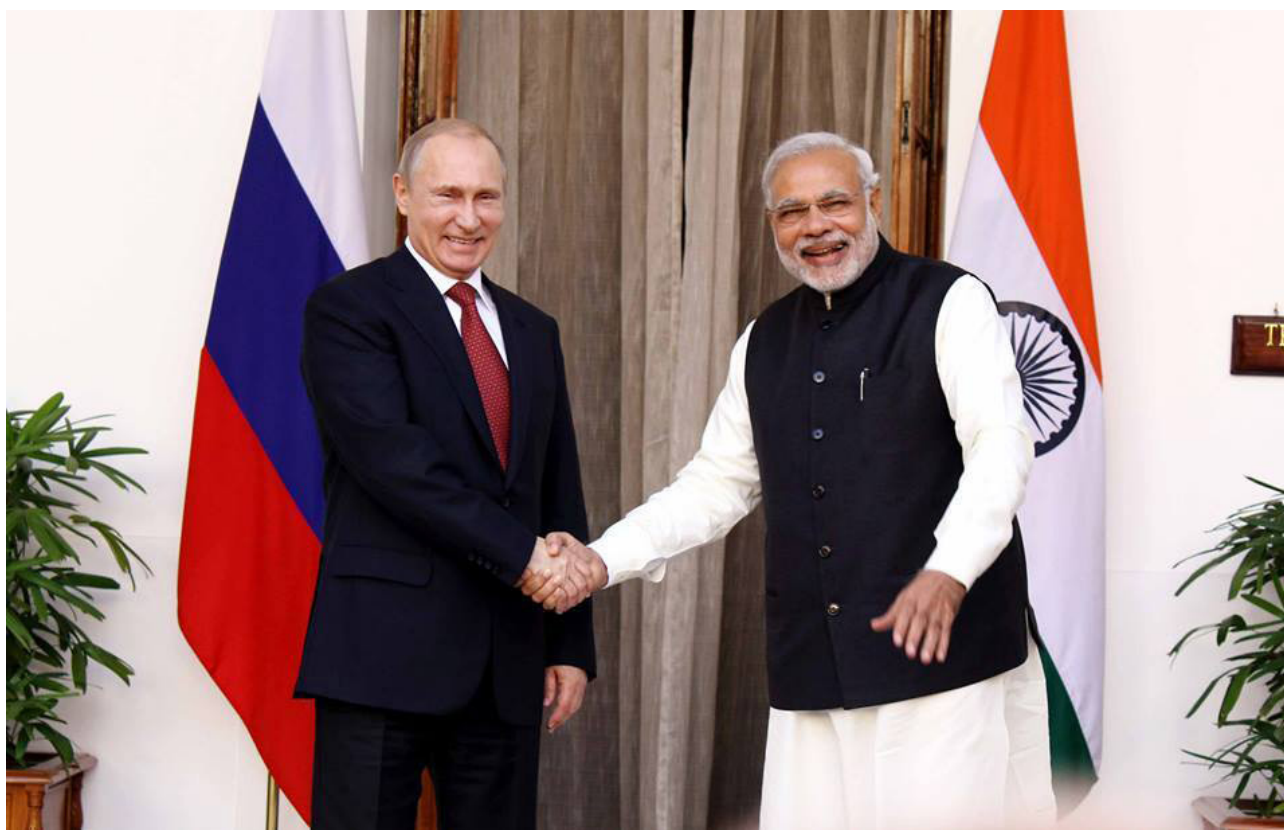
Премьер-министр Нарендра Моди и Президент России Владимир В.Путин

10-11 декабря 2014г. Президент Российской Федерации Е.П. г-н Путин В.В. посетил Индию с официальным визитом для участия в 15-м ежегодном двустороннем саммите