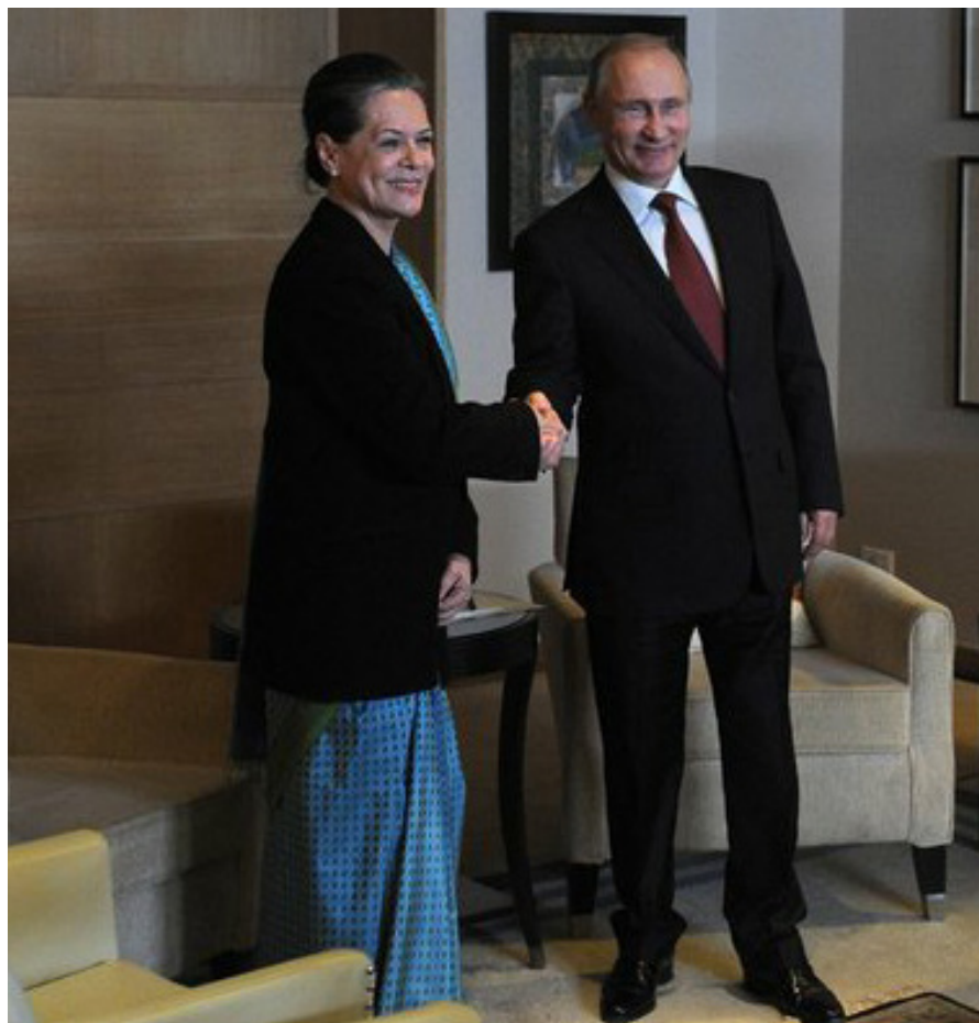
Президент ИНК Соня Ганди с Президентом России В.В.Путиным

зданная с этой целью Рабочая группа подготовит рекомендации по устранению имеющихся барьеров и стимулированию расчетов в национальных валютах. Лидеры согласились, что инициатива Евразийской экономической комиссии и Индии о формировании Совместной исследовательской группы (СИГ) по изучению возможности заключения соглашения о всеобъемлющем экономическом сотрудничестве, охватывающем торговлю товарами, услугами, инвестиционное взаимодействие, передвижение людей и взаимное признание стандартов, имеет огромное значение для двусторонней экономической кооперации. Россия окажет поддержку продуктивной работе СИГ с тем, чтобы данная группа завершила свою работу в оптимальные сроки. Лидеры отме-