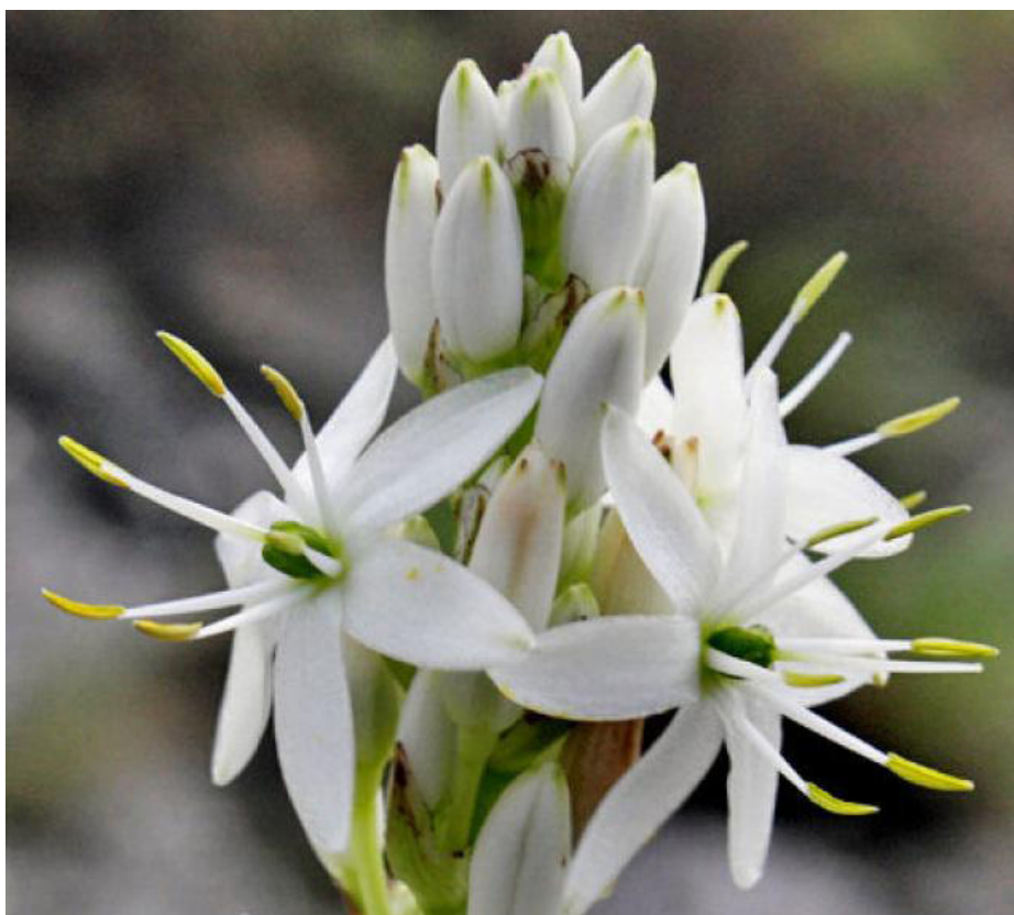
Chlorophytum palghatense - новый вид травянистого растения, свойственный степным природным лесам Дхони и Мутхикулам в Западных Гхатах.