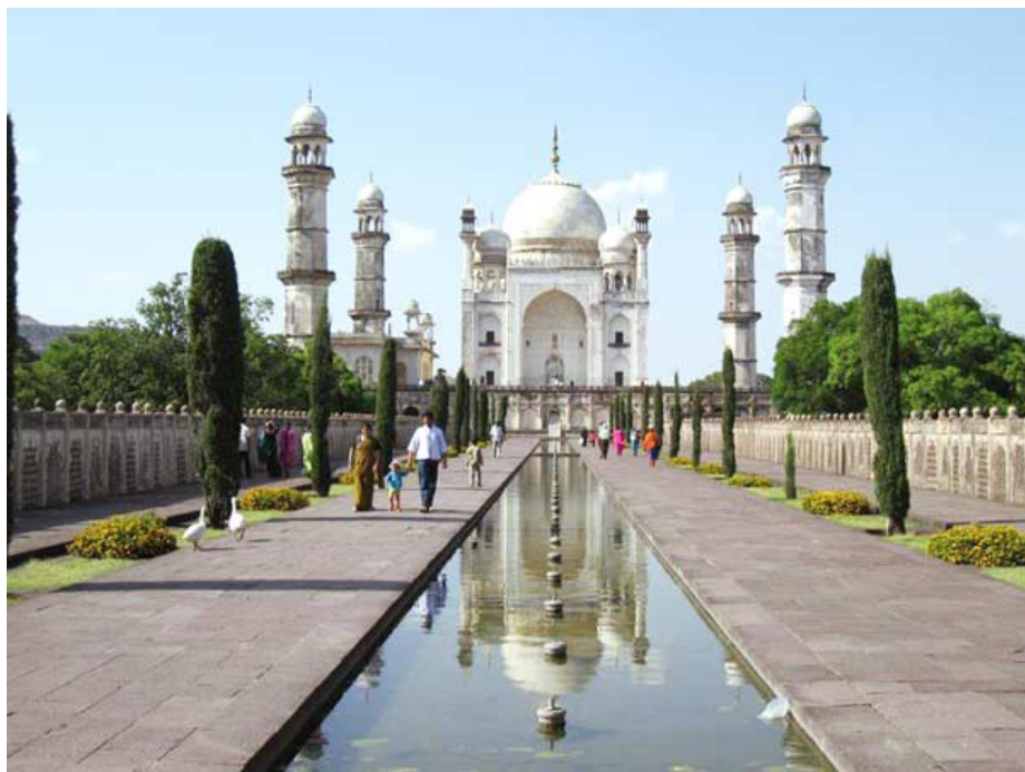
Биби ка Макбара

Форт Даулатабад возвышается существенно на более чем 600 футов выше равнины Декана. Это - один из лучших в мире сохранившихся крепостей средневековья, а также один из нескольких неприступных фортов в Махараштре с пре-