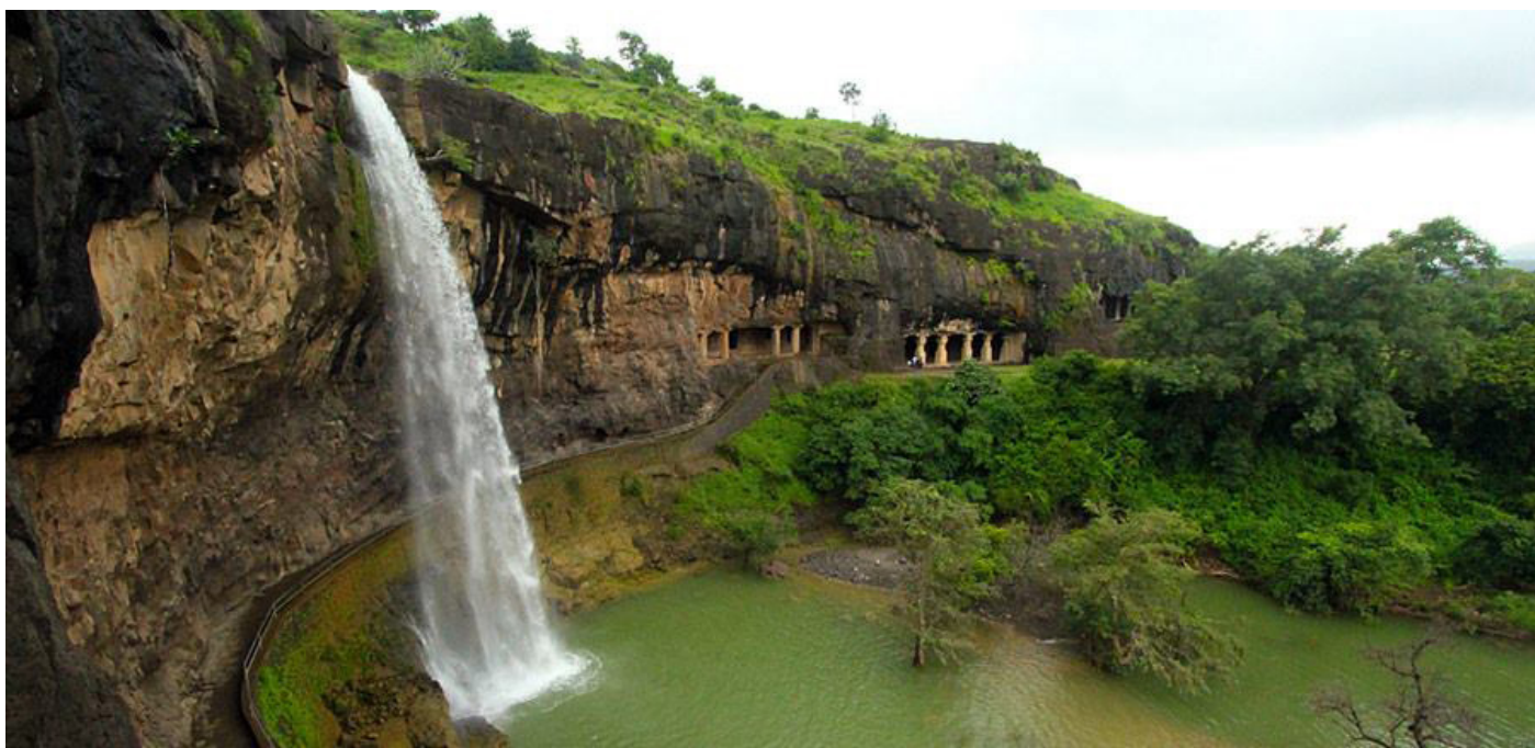
Пещеры Эллора, Махараштра

Эллора представляет миру прекрасный образец индийской скульптуры. Впечатляющий грандиозный храм Кайласа, вырубленный в скале, посвящен горе Кайлас в Гималаях, обитель Господа Шивы. Это монолитная структура является очень редким явлением и одним из крупнейших в мире тяжелой скульптуры, которая требовала наиболее тщатель-