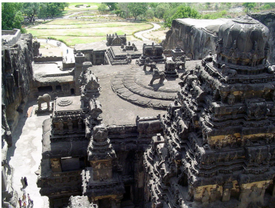
Храм Кайласа в Эллоре