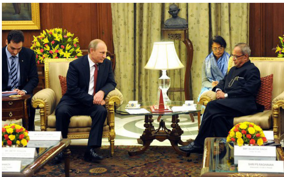
Встреча Президента Индии и Президента России

го сотрудничества в области энергетики. В этом контексте стороны отмечают, что первый Азиатско-Тихоокеанский энергетический форум (АТЭФ), прошедший во Владивостоке в мае 2013 года, заложил основу для расширения регионального энергетического диалога под эгидой Экономической и социальной комиссии для Азии и Тихого океана (ЭСКАТО). При этом они будут руководствоваться положениями Декларации министров АТЭФ и Плана действий по региональному сотрудничеству в целях повышения энергетической безопасности и рационального использования энергии в Азиатско-Тихоокеанском регионе на 2014–2018 годы, одобренных резолюцией ЭСКАТО 70/9.