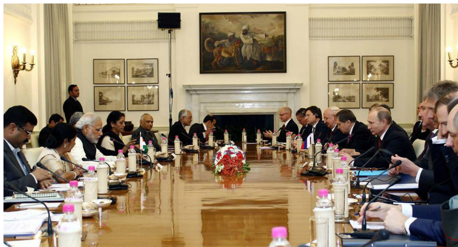
Премьер-министр и Президент России Е.П. г-н Путин В.В. на переговорах в расширенном составе, Нью Дели (11 декабря 2014г.)

5. Двусторонняя программа по расширению сотрудничества в нефтегазовой сфере отражает твердую приверженность сторон развитию взаимодействия в этой чрезвычайно перспективной области. Лидеры рассчитывают