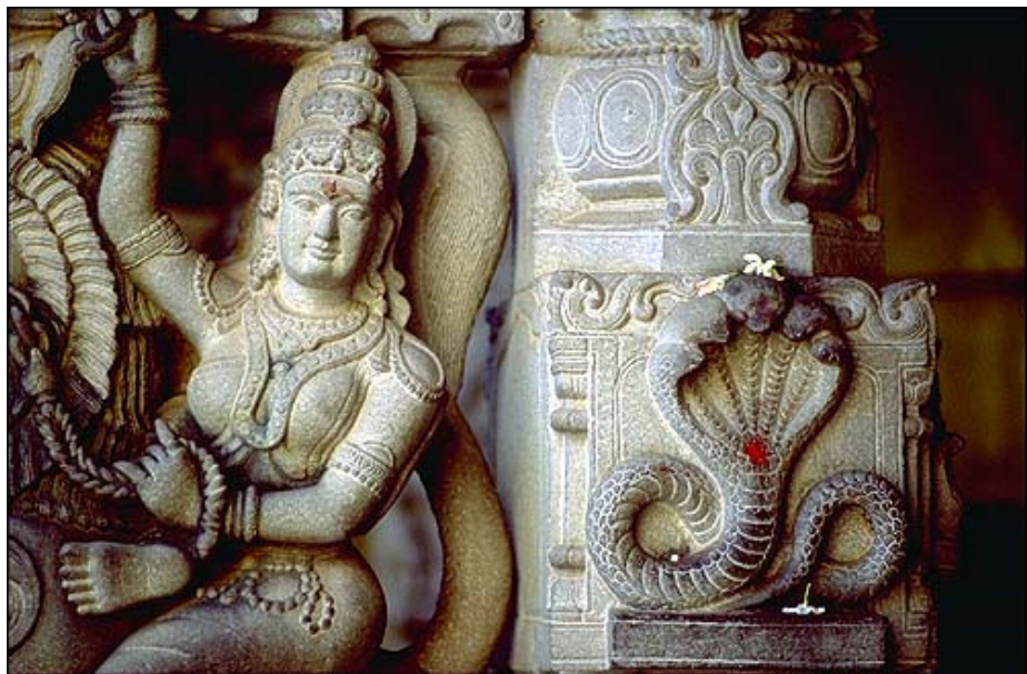
Статуя в Индуитском храме, Аджанта

Невероятные пещерные храмы Индии освещают повседневный быт ранних людей, демонстрируют их веру, и являются замечательными аренами искусства — ими невозможно не восхищаться.