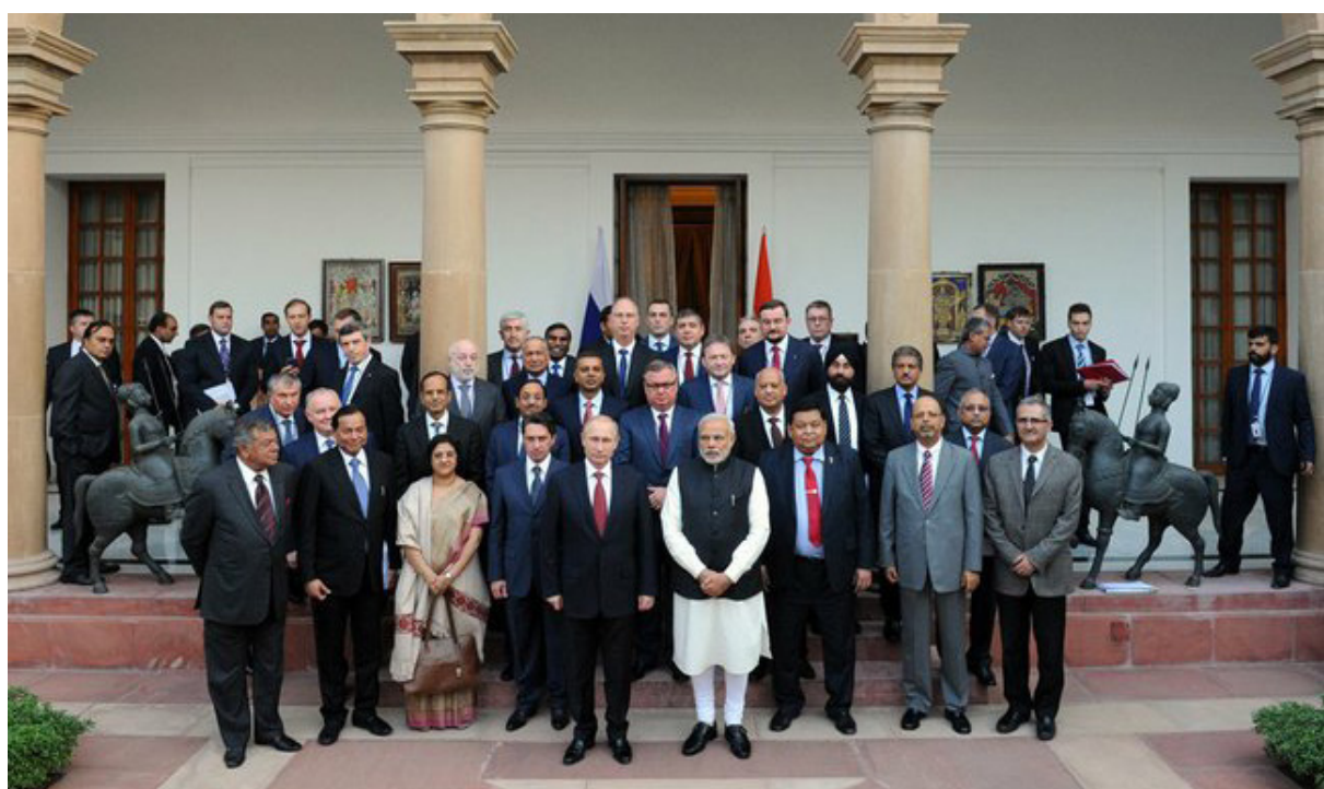
Руководители предприятий Индии и России с Премьер-министром Моди и Президентом Путиным

35. Переговоры двух лидеров и принятые ими решения, а также подробные договоренности в рамках двустороннего диалога позволяют им с уверенностью заявить о том, что объективные политические, экономические, культурные, а также относящиеся к сфере безопасности факторы выведут российско-индийское партнерство на уровень, отвечающий чаяниям их народов. Отношения между Россией и Индией прошли испытание временем и продолжают носить характер дружбы, в основе которой лежит полное доверие, что принесет счастье и процветание народам обеих стран.