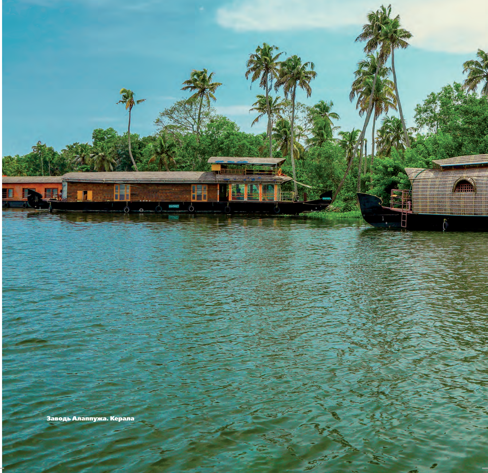
Заводь Алаппужа. Керала