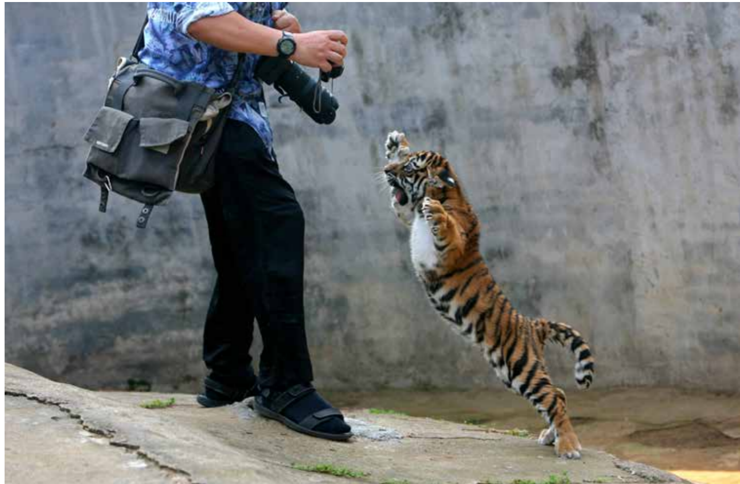
Общение с тигром способно подарить вам незабываемые кадры

сячи особей в 2015-м. Двумя «тигриными сверхдержавами» остаются Индия – страна Маугли и Шерхана и Россия, в которой неописуемые красоты дикой природы Дальнего Востока на протяжении столетий были немислимы без знаменитого амурского тигра.