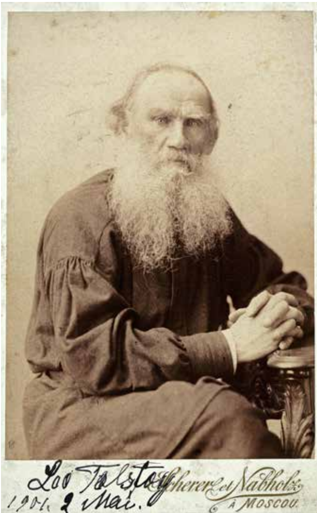
Великий русский писатель Лев Толстой с его идеями ненасилия стал одним из самых популярных писателей в Индии

ки относят конец средневековья в обеих странах к моменту тесного контакта с западной культурой: в России таким периодом считают рубеж семнадцатого и восемнадцатого века, в Индии – период «зрелого» колониализма в девятнадцатом веке. «Англомания» девятнадцатого века в Индии очень походила на «галломанию» этого же периода в России. Ответом на ускоренную вестернизацию стало появление сторонников сближения с Западом (западников) и почитателей «особого пути» своей страны (в Индии их впоследствии назовут этнофилами, в России – славянофилами).