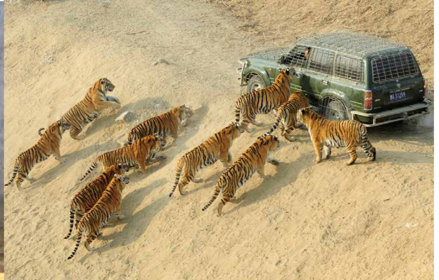
Усилия по спасению полосатых хищников дают свои плоды – их популяция растет

Как следовало из его установочного заявления, «выгоды от сохранения тигров огромны, но нематериальны». «Мы не можем количественно оценить их с экономической точки зрения. Но надо учесть, что тигр, стоящий на вершине экологической пирамиды и пищевой цепи, требует большого количества добычи, что возможно лишь при условии сохранения хороших лесов», – продолжал