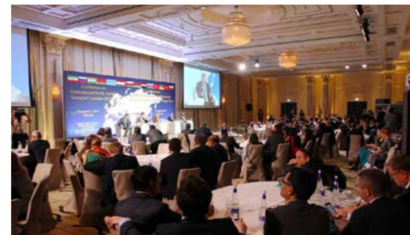
Конференция по Международному транспортному коридору «Север – Юг» стала первым подобным мероприятием, проведенным в российской столице